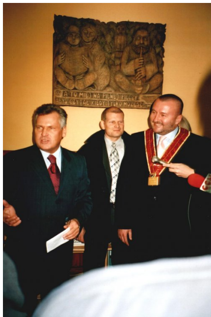
Powitanie Prezydenta RP na uroczystości otwarcia Klubu Biblionetu w Miejskiej Bibliotece Publicznej w Wiśle